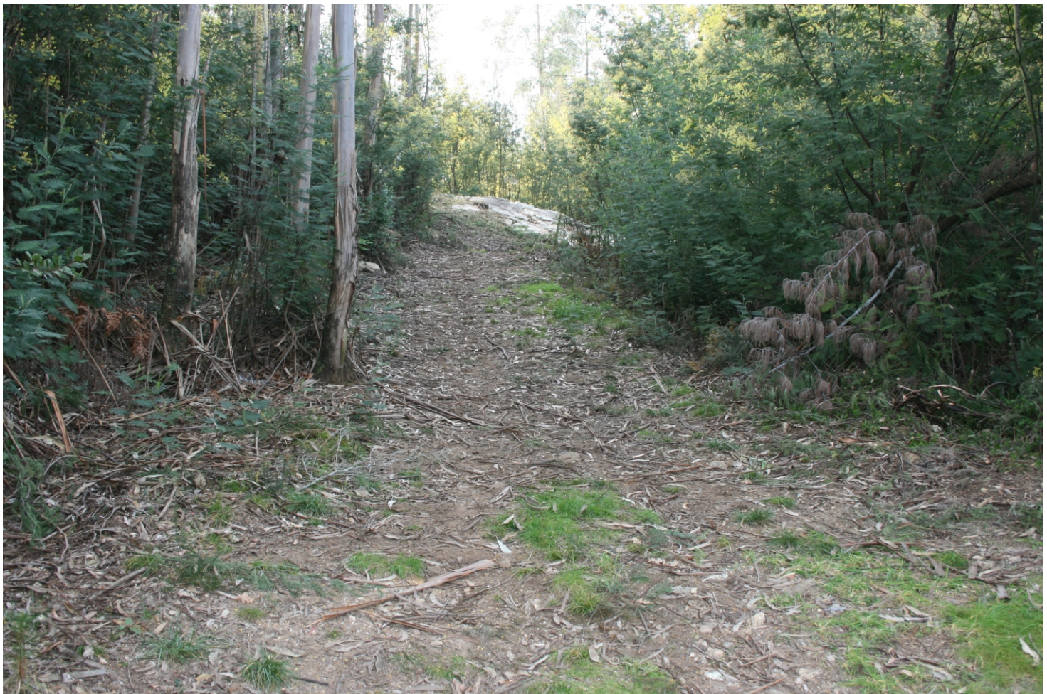
Acceso aos gravados dende o cruceiro de Coveliño