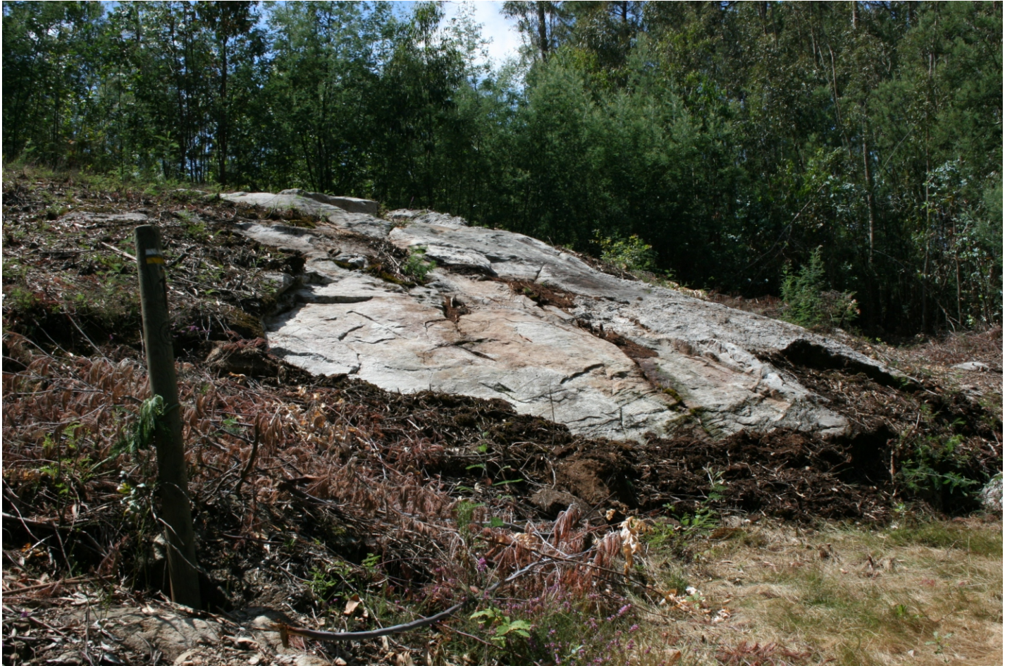
Lugar no que se atopan os gravados de Pedra da Craba ou Cabra