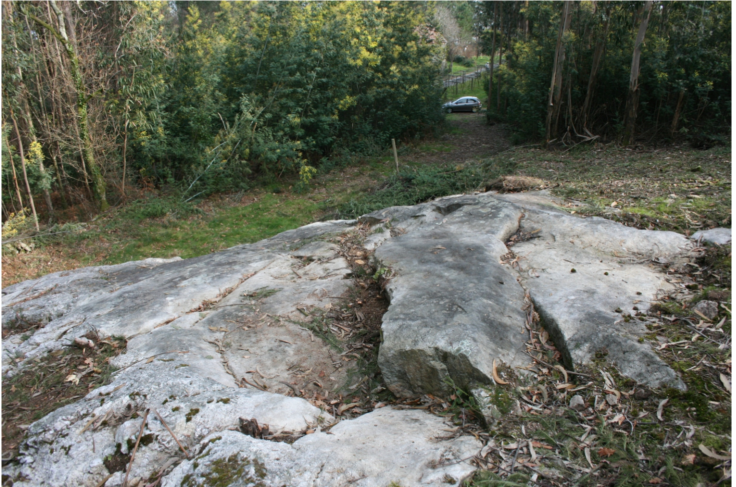
Afloramento sobre o que se atopan algúns dos gravados

Certos animais presentan cualidades “especiais” como pode ser o cervo, que nalgúns relixións animistas representa o espírito do bosque pola súa cornamenta ramificada que evoca ás ramas das árbores e muda estacionalmente as hastas, simbolizando a morte e posterior renacemento. Algúns investigadores teñen fixado a súa atención sobre a combinación da representación de figuras de animais e motivos xeométricos (círculos, coviñas, ...) que teñen interpretado como imaxes cun alto contido simbólico con evidentes connotacións funerarias e astrais, e que teñen interpretado como “follas de ruta do Máis Alá”, outros polo contra, téñeno relacionado coas prácticas máxicas da fecundidade.