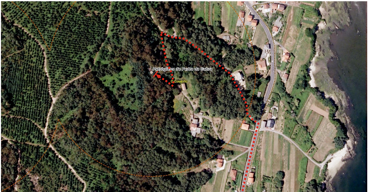
Acceso e localización do petróglifo da Craba