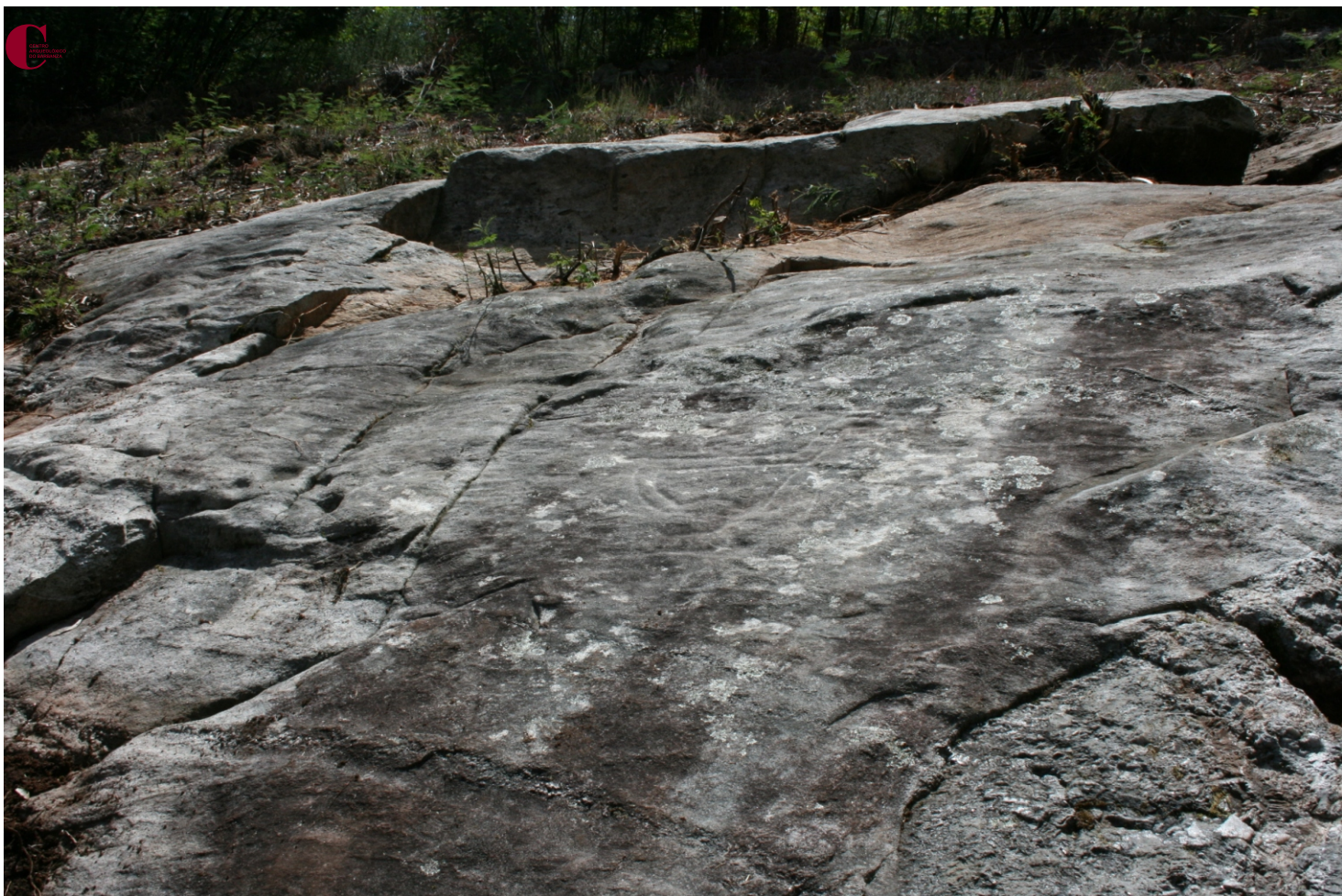
Pedra da Craba ou Cabra